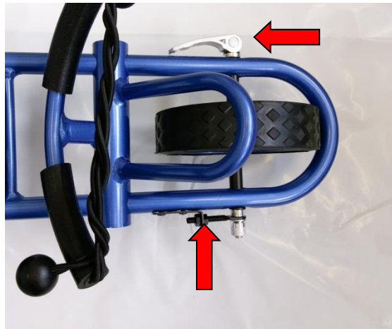
Illustration 7 : Déplacement en ligne droite

Veillez d'abord à ce que le poids dans le sac de golf soit réparti à peu près régulièrement sur les côtés gauche et droit. Si c'est le cas, vous pouvez desserrer légèrement les écrous argentés des deux côtés de la roue avant. Ensuite, le petit écrou noir peut être légèrement serré ou desserré, afin d'ajuster le «déplacement en ligne droite».