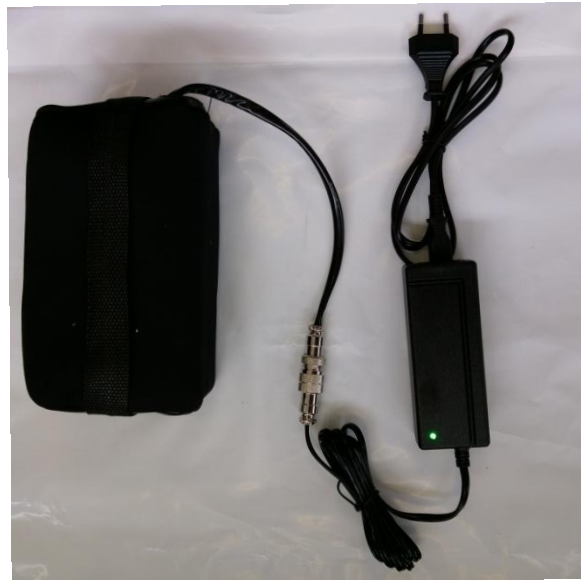
Illustration 4 : Batterie et chargeur

La batterie est chargée à environ 50% en usine. Avant la première mise en marche du chariot, vous devrez charger la batterie avec le chargeur fourni jusqu'à ce que le voyant LED du chargeur passe du rouge au vert. La batterie convient à 27 trous, en fonction de la durée de la partie et des conditions de jeu. La durée de charge d'une batterie vide est d'env. 8 heures.