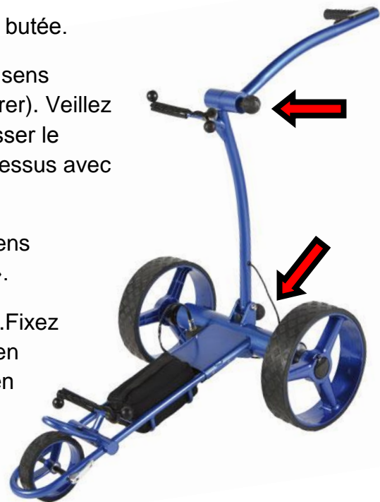
Illustration 3 : Vis en balle de golf inférieure

Important: les filetages doivent s'imbriquer! Ne pas continuer de serrer si les filetages ne s'imbriquent pas, au risque de provoquer des dommages importants.