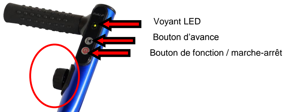
Illustration 6 : Élément de commande

Dès que le voyant LED est rouge, la batterie doit être rechargée.