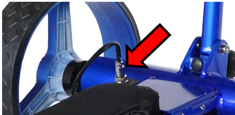
Illustration 5 : Fiche de branchement de la batterie

Branchez la fiche de branchement de la batterie dans la prise de la batterie en la fixant avec l'anneau métallique. Veillez à ce que l'encoche de la petite fiche argentée s'enclenche bien sur la partie intérieure noire.