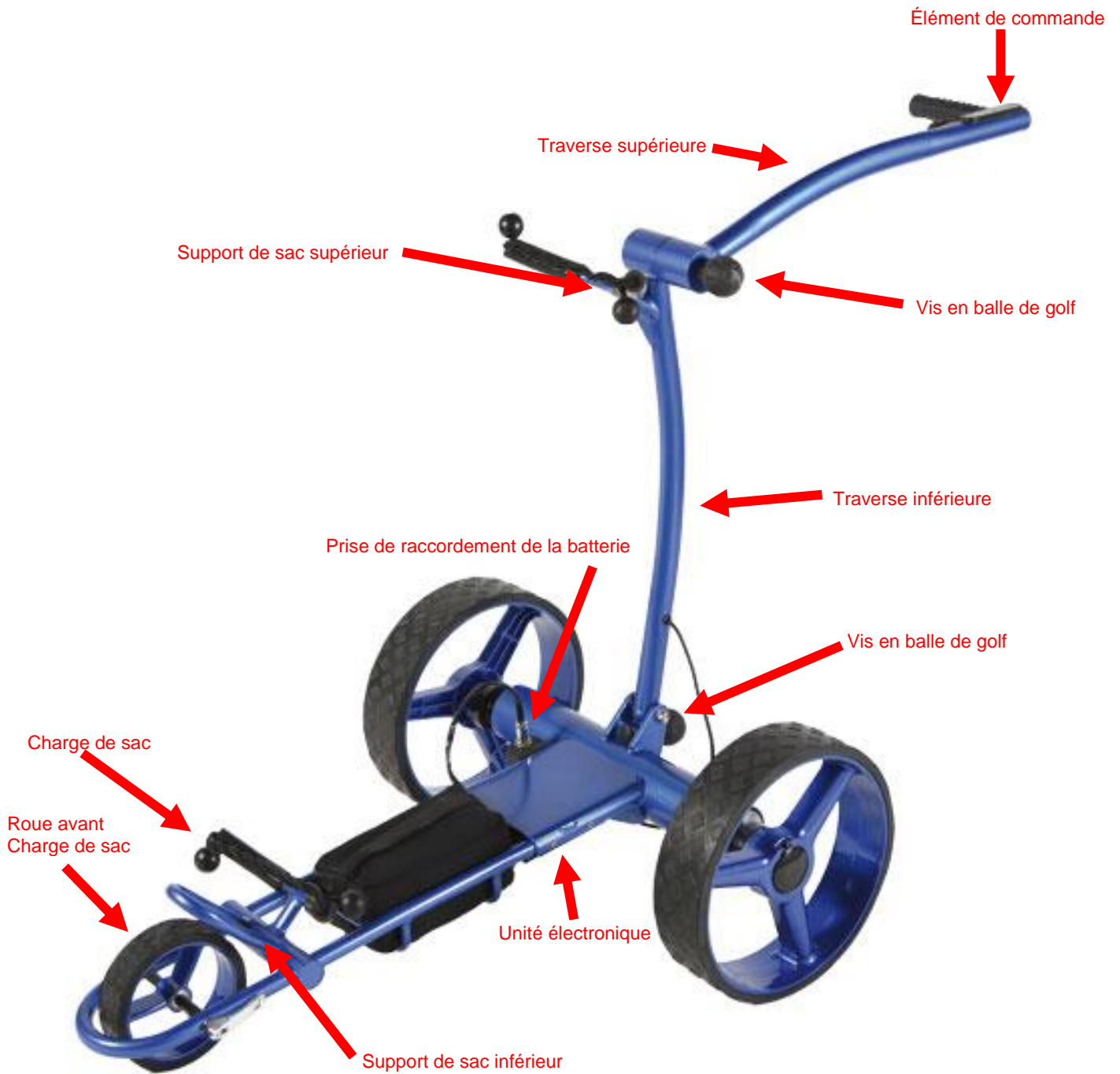
Illustration 1 : Vue d'ensemble du chariot de golf électrique

Sous réserve de modifications du texte et de l'image!